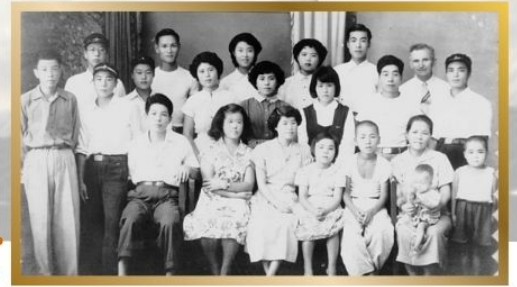
牛深キリスト教会集合写真。アーサー師と ▶

め、集会を解散することにして、終わる前に皆で心を合わせて祈り始めました。すると、風はおさまり静かになって、私達は最後まで礼拝を続けることができました。