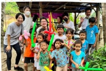
▲ 村の子ども達と交流しました♪

今後も、貴重な経験となる「体験ツアー」を企画して参ります。 この機会を通して、更に、海外伝道の働きに情熱をもつ方々が、 宣教への思いが、増し加えられることを願っています。