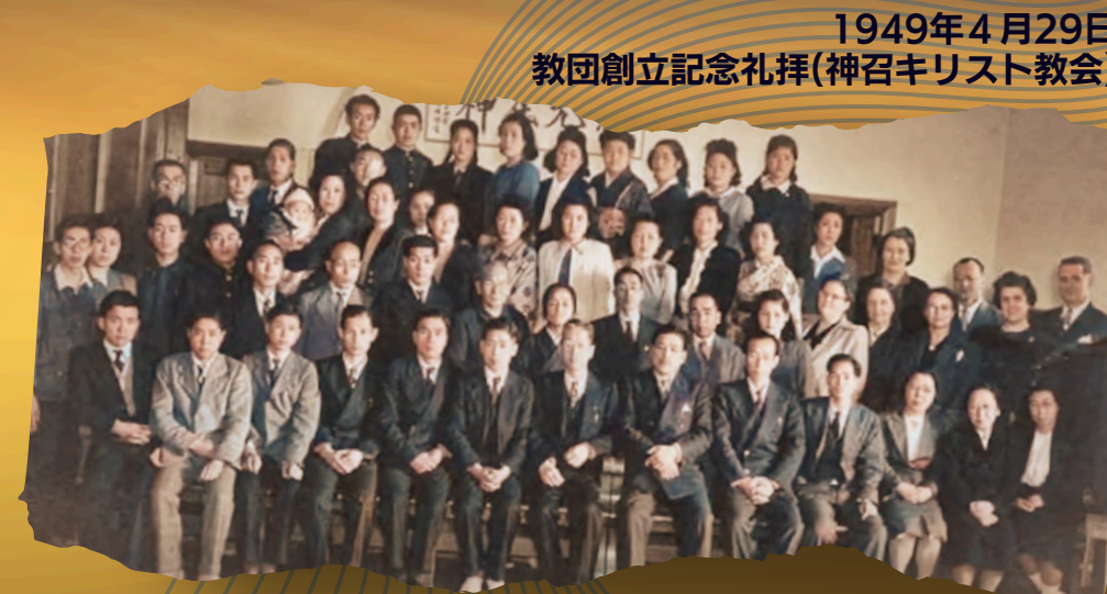
1949年4月29日 教団創立記念礼拝(神召キリスト教会)