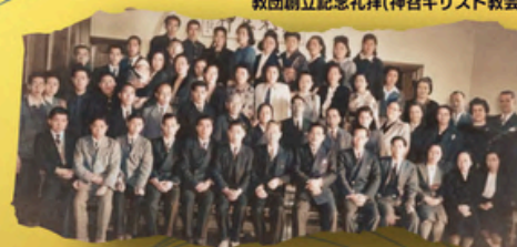
1949年4月29日 教団創立記念礼拝(神召キリスト教会)