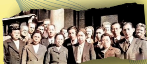
日本アッセンブリーズ・オブ・ゴッド教団のチャーター・メンバー (1949年3月の神召キリスト教会における教団創立総会にて)