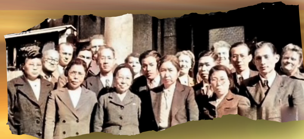
日本アッセンブリーズ・オブ・ゴッド教団のチャーター・メンバー (1949年3月の神召キリスト教会における教団創立総会にて)